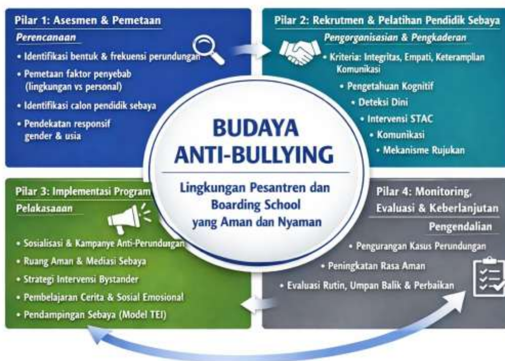
Gambar 2. Kerangka Manajemen Peer Education Empat Pilar